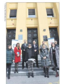
ČLANICI ZDRAVSTVENIH KOMORA: Borba protiv pandemije je maraton, a ne sprint.