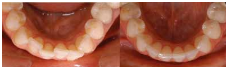
Slika 4: Prikaz stanja donje čeljusti prije i nakon terapije Invisalignom

terapije Align Technology izrađuje udlage za cjelokupnu terapiju. Pomoću tih udloga prenosi se pomak zuba iz računalne simulacije u pacijentova usta. U cjelokupnom tijeku terapije liječnik može provjeravati je li pomak zuba istovjetan planiranom uz pomoć ClinCheck™ programa (Slika 1 i 2).