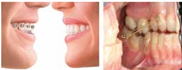
Slika 3: Prikaz udlage in situ. Desna slika prikazuje kompozitne etečmene i pomoć gumica pri terapiji malokluzije klase II/1.